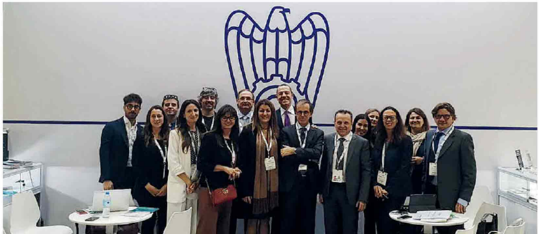
Foto di gruppo degli imprenditori in trasferta negli Emirati Arabi Uniti

L'iniziativa si colloca all'interno del percorso "Verso Expo