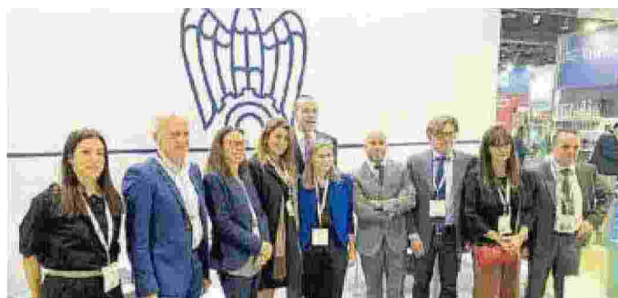
Alcuni reggiani negli Emirati Arabi per la fiera Big Five Dubai

REGGIO EMILIA. Sei imprese reggiane e altre tre aziende dell'Emilia-Romagna del settore abitare-costruire sono in missione a Dubai fino al 29 novembre per partecipare alla fiera Big Five Dubai, salone internazionale dell'edilizia e sistema casa, nell'ambito del progetto