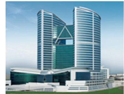
Jafza One Building

Italian Incubator - Your gateway to world trade